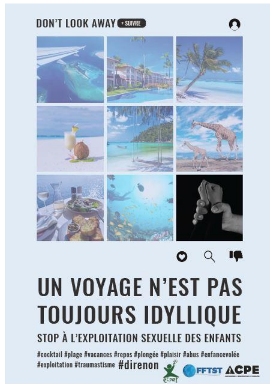
Affiche gagnante de l'édition 2018 IEFT Lyon