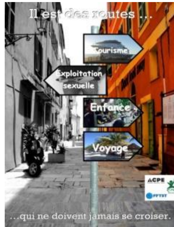
Affiche gagnante de l'édition 2017 Lycée Saint Vincent de Paul (Nîmes)