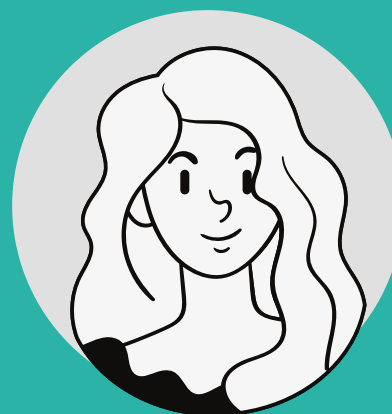
REFERENT PROJET RESPONSABLE RESEAU GREETER LOCAL OU MEMBRE DU COPIL DE LA FEDERATION FRANCE GREETER SELON LA NATURE DU PROJET

Pour ce projet mené par France Greeters au niveau national, nous nous appuyons sur l'outil de Gemmici , qui propose une carte communautaire valorisant des contenus d'expériences (de blogueurs dans un premier temps, mais aussi d'habitants à terme). Côté Système d'Information Touristique (SIT) nous sommes devenus sociétaires de la SCIC Apidae Tourisme avec qui nous travaillons à l'intégration d'une donnée d'expérience complémentaire aux informations objectives déjà présentes.